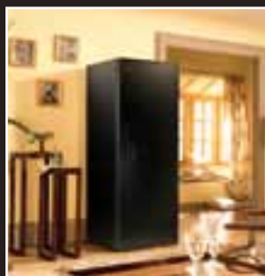
Caves à vins - Gamme Première Wine Cabinets - Première Range