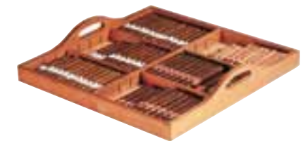
Plateau de présentation sur clayette coulissante (en bois exotique imputrescible). Presentation tray on sliding rack (in rot-proof exotic wood).