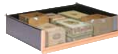
Tiroir de rangement Storage drawer

La Cave à Cigares est étudiée pour être évolutive. Plusieurs types de rangements vous sont proposés pour répondre au mieux à vos besoins.