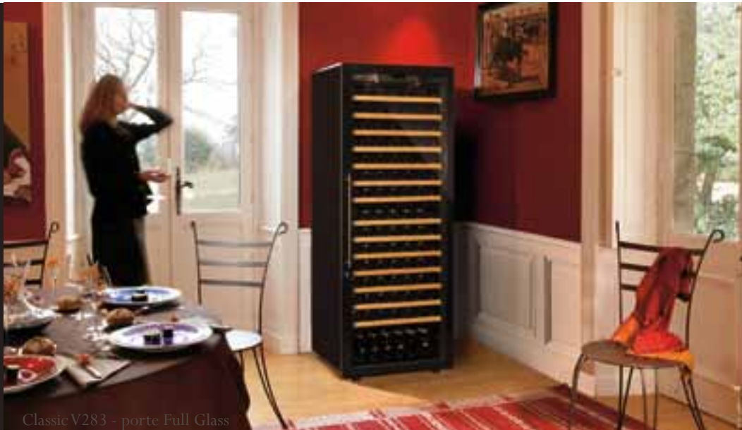
Classic V283 - porte Full Glass