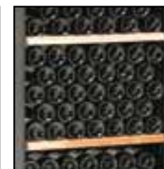
Clayettes de stockage

Coque bi-matière pour absorber les vibrations et protéger vos bouteilles.